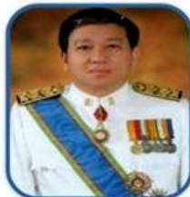
รศ.ดร.นพ.พิทยา จารุพูนผล ที่ปรึกษา