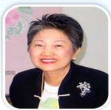
ดร.เจริญจิต จามทิพยพันธุ์ อุปนายก